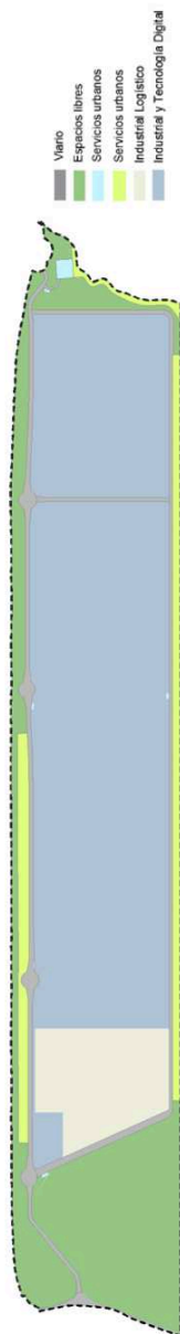
Plano de redelimitación del sector SUI-4 actualizado